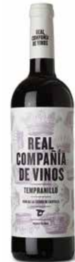
Real Compania de Vinos Tempranillo