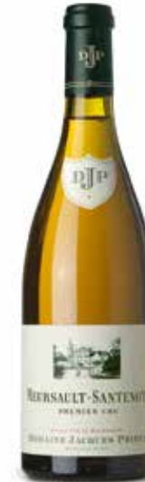
Meursault 1er Cru Santenots

Das Weingut verfügt über 20 Hektar Reben, ausschließlich in den Lagen der Grand Crus und Premiers Crus der Côtes de Nuits und der Côte de Beaune. In Burgund ist es das einzige, in dem Chambertin, Musigny und Montrachet zugleich vertreten sind. Zwei Drittel sind mit der Rebsorte Pinot Noir oder Spätburgunder bepflanzt, das andere Drittel mit Chardonnay oder Weißburgunder.