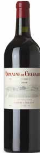
Domaine de Chevalier Rouge 1er Cru Classé