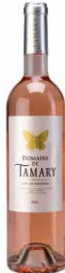
Domaine de Tamary Rosé Côtes de Provence AOC

(40% Grenache, 30% Cinsault, 10% Syrah, 20% Mourvèdre)