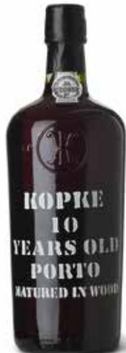
10 Years Old Porto