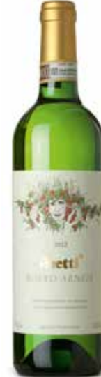
Roero Arneis DOCG