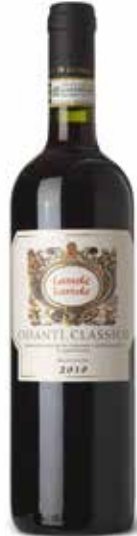
Chianti Classico DOCG