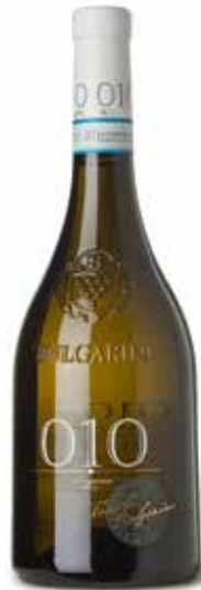
Lugana „010“ DOC