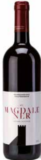
St. Magdalener DOC