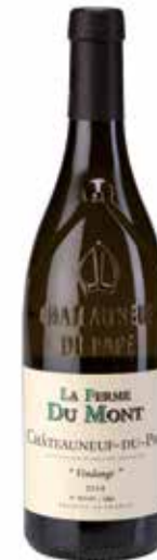
Châteauneuf du Pape „Vendange“ Blanc