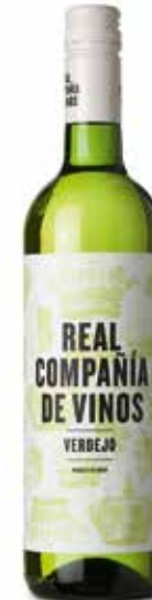
Real Compania de Vinos Verdejo

Sozusagen im Herzen der Rioja, nördlich des Rio Ebro zwischen Haro und Lagrono sitzt die Bodegas Muriel. Genau genommen arbeitet Bodegas Muriel zum größten Teil mit Trauben aus dem Rioja Alavesa. Bei einer in der Rioja nicht untypischen Größe der Bodega mit einer Produktion von gut 2 Mio. Flaschen gibt es ein größeres Portfolio. Insgesamt ist man hier jedoch der Tradition sehr treu und möchte trinkreife Weine mit Feinheit, Eleganz und gemäßigter Kraft erzeugen.