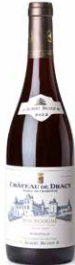
Château de Dracy Bourgogne Pinot Noir