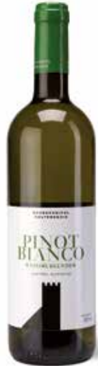
Weißburgunder Thurner DOC