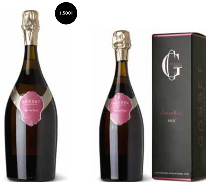
Grand Rosé Brut

Dieser Champagner ist aus Weinen dreier Jahrgänge komponiert. In Antikflaschen lagert er bis zu vier Jahren im Keller. Die elegante Cuvée von hellrot-goldener Farbe präsentiert sich vollmundig, weinig, mit Noten von trockenen Feigen, Mandeln und Zwieback.