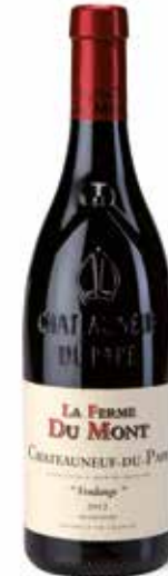
Châteauneuf du Pape „Vendange“ Rouge