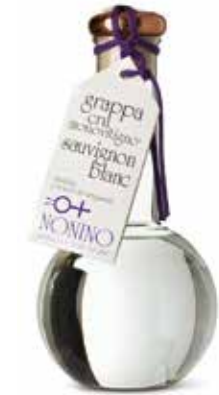
Grappa di Sauvignon „Cru Monovigno“ Cru Collio Friulano