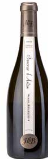
Sancerre Blanc D'Antan AOP