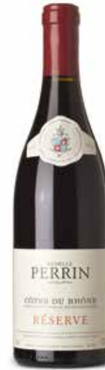
Perrin Réserve Rouge Côtes du Rhône A.C.

(Roussanne 15%, Grenache blanc 50%, Viognier 20%, Marsanne 15%)