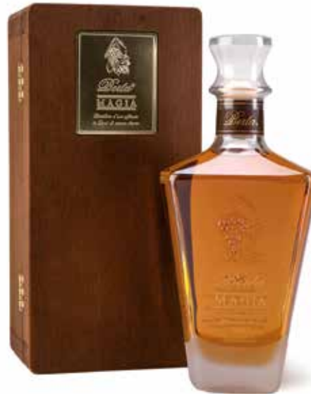
Grappa Magi 10 Jahre fassgelagert