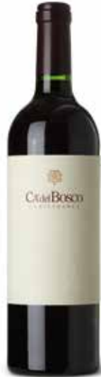
Curtefranca Rosso DOC