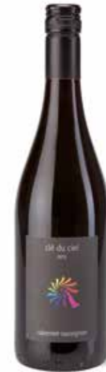
Clé du Ciel Cabernet-Sauvignon IGP

Eine strahlende, kirschrote Farbe und ein fruchtiger, feiner und eleganter Duft charakterisieren diesen Wein mit dem Aroma reifer roter Früchte und Pfeffer. Am Gaumen saftig, weich und von großer Feinheit. (100% Merlot)