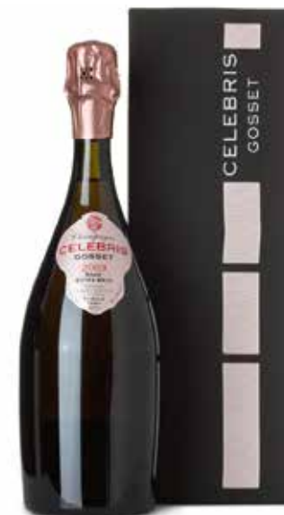
Celebris Rosé Extra Brut