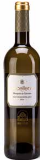
Excellens Sauvignon Blanc DO Rueda