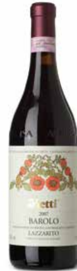
Barolo Lazzarito DOCG