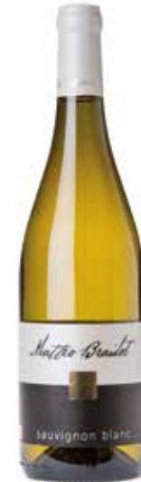
Sauvignon Blanc IGT

Wir haben eine Weinkellerei auf einem derartigen Weg entwickelt, der fest in seinen Ursprüngen verwurzelt ist. Dies wurde durch harte Arbeit, großer Hartnäckigkeit, Leidenschaft und mit voller Hingabe an das Land erreicht.