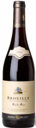
Brouilly Roche Rosé Beaujolais