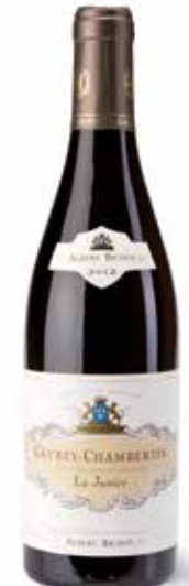
Gevrey-Chambertin La Justice