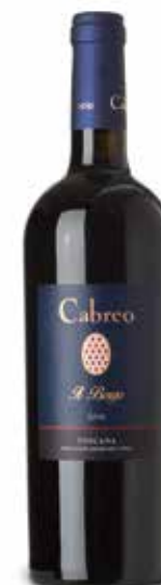
Cabreo Il Borgo