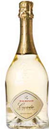
Spumante Extra Dry Cuvée „Prima Stella“