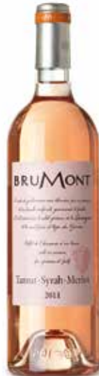
Rosé IGP Côtes de Gascogne

Die selten fruchtige Rebsorte Gros Manseng wird mit einem eleganten Sauvignon verbunden. Ein ungewöhnlicher Wein mit einer geringen Restsüße ist das Resultat. (50% Gros Manseng, 50% Sauvignon)