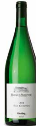
Haus Klosterberg trocken Riesling

Das Weingut hat seinen Sitz leicht erhöht über der Mosel, inmitten der Lage Wehlener Klosterberg und mit Blick auf die Zeltinger Weinberge.