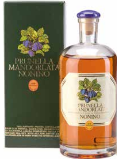
Prunella Mandorlata Likör