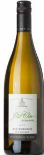
Petit Clos Sauvignon blanc