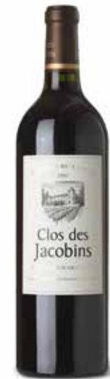
Clos des Jacobins St. Emilion Grand Cru

(33% Merlot, 33% Cabernet Franc, 33% Cabernet-Sauvignon)