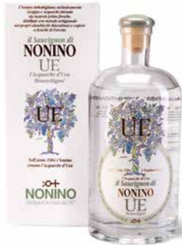
Ùe di Sauvignon „Monovitigno“ Acquavite d’Uva (Traubenbrand)