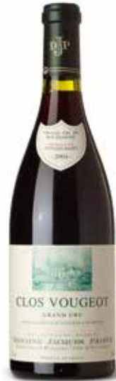
Clos Vougeot Grand Cru