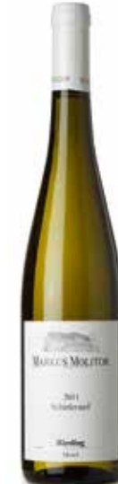
Schiefersteil trocken Riesling