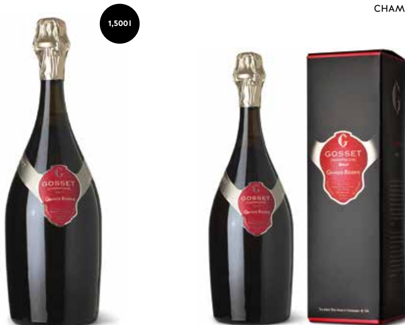
Grande Réserve Brut