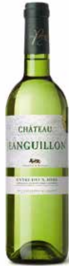
Château Jeanguillon Entre Deux Mers Blanc