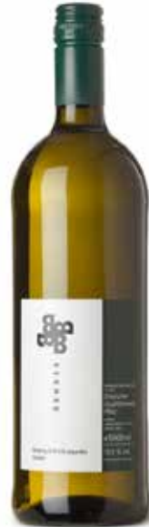
Riesling/Weißburgunder QbA Pfalz

Klassische Cassisfrucht, feine Tannine, Schokolade. (100% Cabernet-Sauvignon)