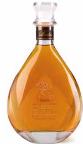
Riserva del Fondator „Paolo Bert“ 20 Jahre fassgelagert

(ausgewählte Moste aus Trauben aus der Region)