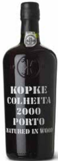
Colheita 2000 Porto