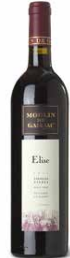
Moulin de Gassac Elise Rouge IGP Pays d'Herault

Reife Schwarzfrüchte, Aromen von Brom- und Heidelbeeren, gut strukturiert, rund, fruchtige Art, saftig, Röstaromen, feines Tannin, ein gelungener, typischer Merlot. (100% Merlot)