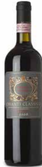
Chianti Classico Riserva DOCG