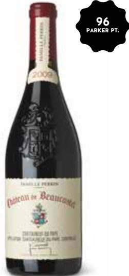
Châteauneuf du Pape Rouge Château de Beaucastel