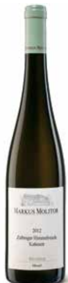
Riesling Zeltinger Himmelreich Kabinett feinherb