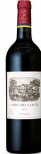
Domaine de Rothschild Carruades de Lafite

(83% Cabernet-Sauvignon, 13% Merlot, 4% Cabernet-Franc)