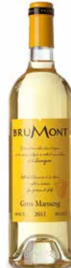
Gros Manseng Doux IGP Côtes de Gascogne

Drei große komplementäre Rebsorten für einen außergewöhnlichen Rosé. Velour und Seidigkeit des Merlot, Energie und Lebendigkeit des Tannat, Himbeer und Johannisbeer des Syrah. (Tannat, Syrah, Merlot)