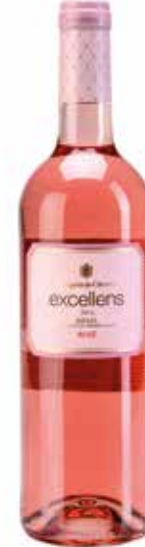
Excellens Rosé DOCa Rioja