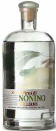
Pirus Obstbrand Acquavite di Pere Williams Acquavite di Frutta