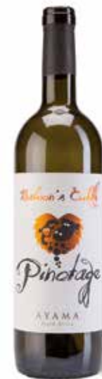
Pinotage Baboon's Cuddle