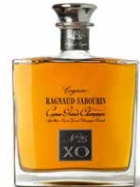
X.O. Alliance No. 25 1er Cru de Cognac

Ist tiefgolden, leicht bernsteinfarben und 20 Jahre alt. Dank der Verwandlung der Gerbsäure verspürt man Fülle und Weichheit auf dem Gaumen.