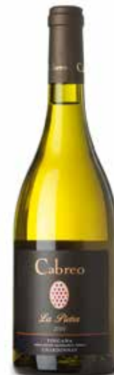
La Pietra Chardonnay IGT

Die restlichen 20 Hektar der Hanglagen liegen in Panzano (6 km von Greve entfernt, auf 400 Metern Höhe) wo Chardonnay und Pinot Noir angebaut werden.