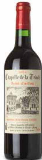
Chapelle de la Trinite St. Emilion AOC