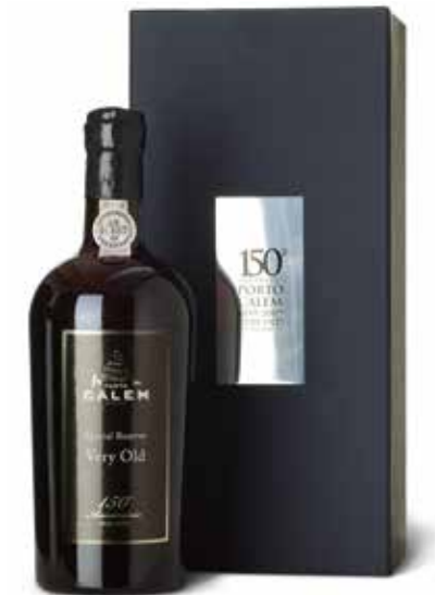
Special Reserve Very Old 150 years in Geschenkverpackung