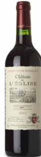
Château de L'Eglise Côte de Bordeaux