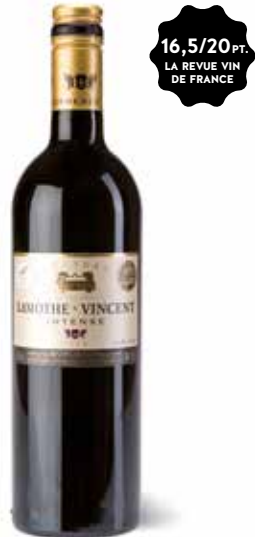
Château Lamothe-Vincent Bordeaux Intense Red