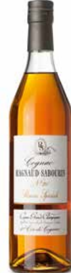
Réserve Speciale Alliance No. 20 / 1er Cru de Cognac

Ist goldgelb und 10 Jahre alt. Nach Umwandlung seines Holzgeschmackes wird sein aromatischer Charakter weicher. Duftet nach Vanille und altem Portwein. Am Gaumen sanft und ausgereift.