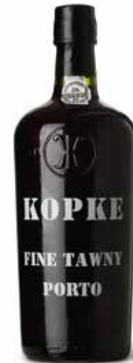
Fine Tawny Porto

Obwohl nicht mehr im Familienbesitz, ist der Name Kopke heutzutage Garant für prestigeträchtige Portweine.