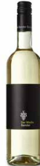
Bender „Der Weiße“ Pfalz

Er produziert sowohl anspruchsvolle und forderne Premiumweine, die Kenner und Liebhaber überzeugen, als auch unkomplizierte, einfach zugängliche Weine für vinophile Novizen.