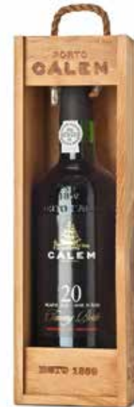
Cálem Portweine in Geschenkverpackung