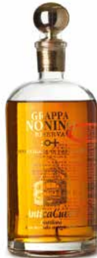
Grappa Antica Cuvee Riserva