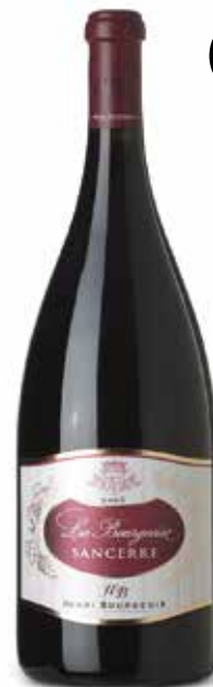
Sancerre La Bourgeoise Rouge