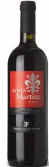
Santa Martina Toscana Rosso IGT

Intensives Rubinrot mit zart granatfarbenen Nuancen. An der Nase eröffnen erste Wahrnehmungen von süßem boisée den Reigen der eleganten, typischen Classico-Duftkomponenten wie Iris und Gewürzen. Am Gaumen erlebt man eine strenge Tanninkomposition. (100% Sangiovese)