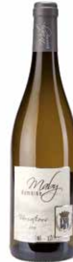
Variations White Côtes du Rhône AOP