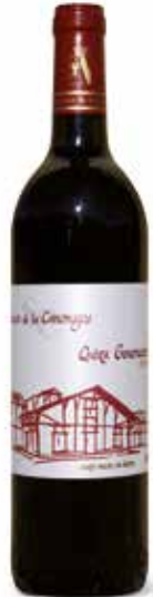
Quinta Generación Roble