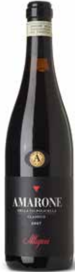
Amarone Classico DOC