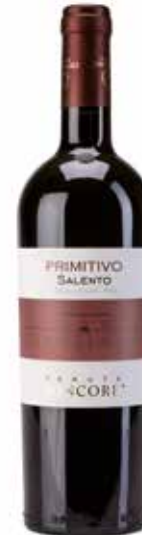
Primitivo del Salento IGT