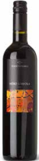
Nero d'Avola IGT