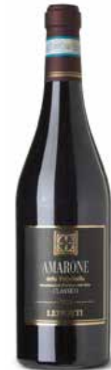
Amarone della Valpolicella DOC

Dunkle rubinrote Farbe. Sein Bukett weinig, intensiv. Trocken jedoch samtiger, warmer, intensiver, körperreicher Geschmack. Ausgezeichneter „Meditationswein“, zu genießen vor dem Kamin. Passt auch gut zu Braten, Wildbret und reifen Käsesorten. (Corvina, Rondinella und Molinara)