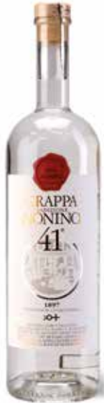
Grappa Tradizione Nonino