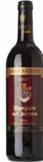
Gran Reserva DOCa

(85% Tempranillo, 7,5% Garnacha Tinto und 7,5% Graciano)