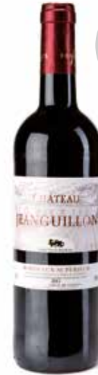
Château Jeanguillon Bordeaux Superieur Rouge

(45% Sauvignon Blanc, 35% Sémillon, 20% Sauvignon Gris)