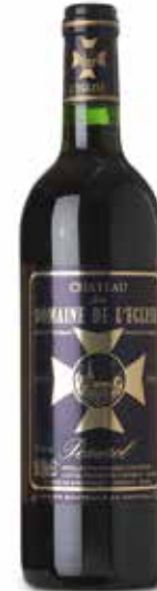
Château du Domaine de l'Eglise Appellation Pomerol Contrôlé

Château du Domaine de l'Eglise ist schon in den „Vieux Papiers du Libournais“ aus dem Jahre 1589 erwähnt und damit das wahrscheinlich älteste Weingut auf dem berühmten Hochplateau von Pomerol. Ursprünglich im Kirchenbesitz, war Domaine de l'Eglise, die Kirchendomäne, ein von Mönchen der ‚Ordre des Chevaliers de l'Hôpital de Saint Jean de Jérusalem‘ geführtes Hospiz. Ein großes Malteserkreuz auf der Flasche erinnert an diese Vergangenheit.