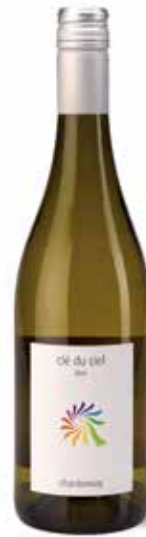
Clé du Ciel Chardonnay IGP

Trockener Wein mit einer goldgelben Farbe und grünen Reflexen, mit einem fruchtigen und blumigen Bukett und einem Parfum aus Weißdorn und Lindenblüte. Passt ausgezeichnet zu Muscheln und gegrilltem Fleisch. (100% Picpoul de Pinet)