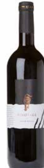
Pinotage Vor Pardeberg