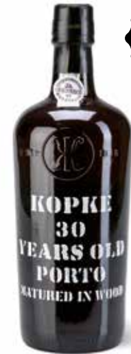
30 Years Old Porto