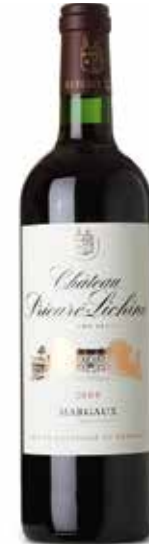
Château Prieure Lichine 4ème Grand Cru Classé

(53% Cabernet Sauvignon, 42% Merlot, 5% Petit Verdot)