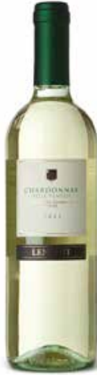
Chardonnay delle Venezie IGT