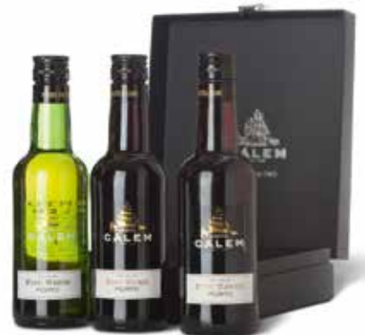
Old Friends „Port for Two“ in Geschenkverpackung

(Malvasia Fina, Viosinho, Codega und Malvasia-Corada)