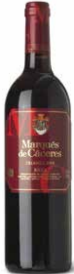
Tinto Crianza DOCa