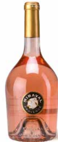
Château Miraval Rosé Côtes de Provence AOP