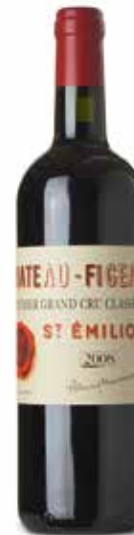
Château Figeac 1er Grand Cru Classé

(55% Merlot, 40% Cabernet Franc, 5% Cabernet-Sauvignon)