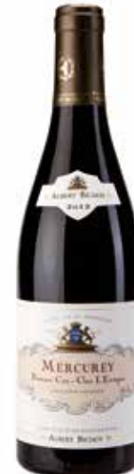
Mercurey 1er Cru Rouge „Clos l'Évêque“ Côtes Chalonnaise