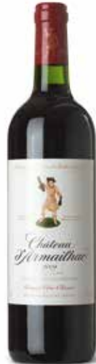
Château D'Armailhac 5ème Cru Classe