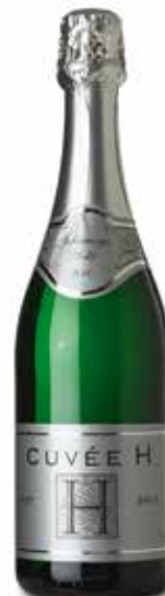
Cuvée H Sekt Cuvée Brut