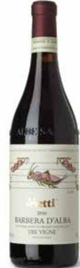
Barbera d'Alba Tre Vigne DOCG