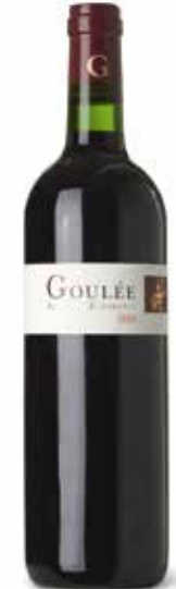
Goulée by Cos d'Estournel Appellation Contrôlée