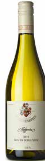
Grauer Burgunder Hofgarten Kabinett trocken