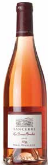
Sancerre Les Bonnes Bouches Rosé