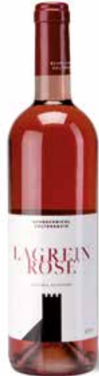
Lagrein Rosé DOC