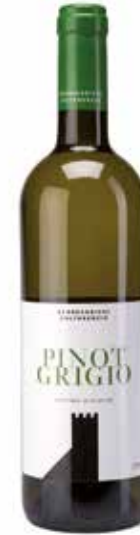
Pinot Grigio DOC