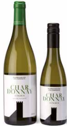
Chardonnay Altkirch DOC