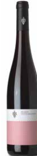
Spätburgunder QbA Pfalz

Leicht, fruchtig und frisch, mit wenig Säure. (60% Riesling, 30% Weißburgunder und 10% Sauvignon Blanc)