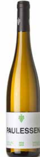
Paulessen Riesling Mosel

Dunkle Beerenfrüchte, leicht, süffig, rund, weiche Tannine. (70% Dornfelder, 30% Merlot)