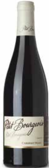
Petit Bourgeois Cabernet Franc