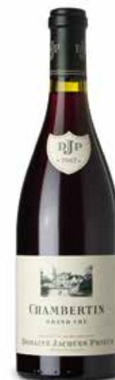
Chambertin Grand Cru