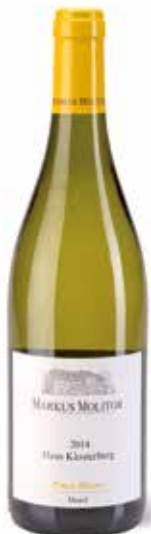
Pinot Blanc Haus Klosterberg