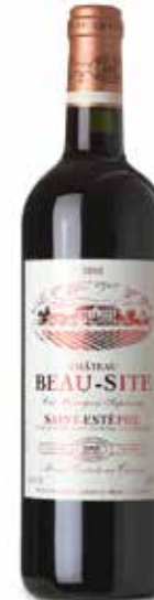
Château Beau Site Cru Bourgeois

Guide Hachette und Decanter empfehlen Beau Site regelmäßig.