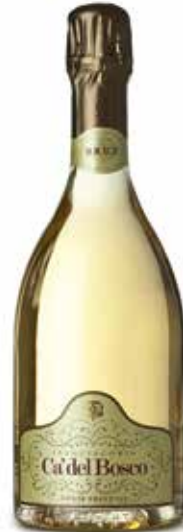
Cuvée Prestige Franciacorta