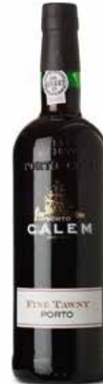
Fine Tawny Porto

Noch heute zeigt das Logo von Porto Cálem eine Caravelle, ein Verweis auf den geschichtsträchtigen Handel von Portwein, mit dem die Erfolgsgeschichte des Hauses begann.