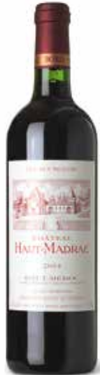
Château Haut Madrac Cru Bourgeois