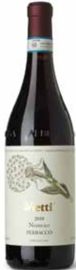
Nebbiolo Perbacco DOCG