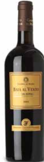
Baia al Vento Bolgheri Rosso Superiore DOC

(60% Merlot, 20% Cabernet Sauvignon, 15% Cabernet Franc, 5% Petit Verdot)