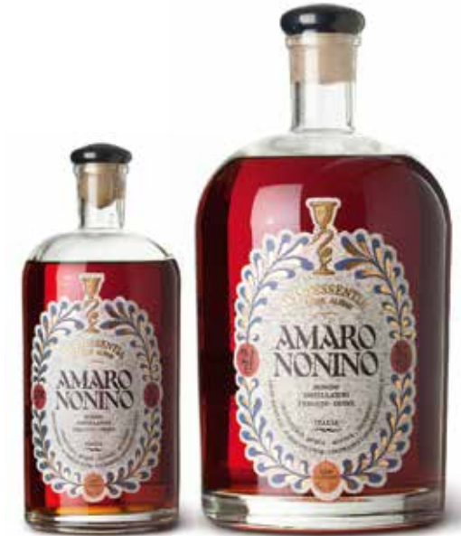
Amaro Quintessentia di Erbe Alpine Amaro Quintessentia