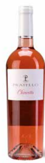
Chiarretto Sant'Emiliano DOC