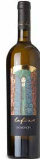
Sauvignon Lafoa DOC

Daraus entsteht ein spannender Mikrokosmos, der naturreine und charaktervolle Weine hervorbringt. Im südlichen Teil des Landes liegt das Überetsch. Eine faszinierende Hügellandschaft aus der letzten Glazialzeit, die mit malerischen Ortschaften durchsetzt ist.