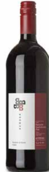
Merlot/Dornfelder QbA Pfalz

Leicht, unkompliziert und fruchtig. (60% Riesling, 40% Weißburgunder)