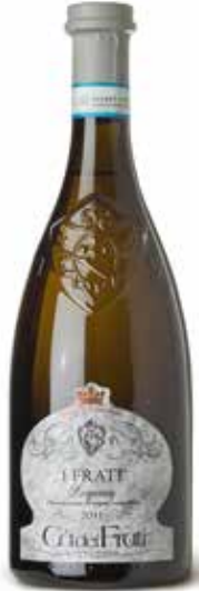
Lugana I Frati DOC