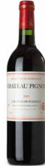
Château Pignon Appellation Pomerol Contrôlé