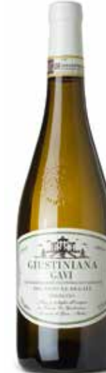
Gavi di Gavi DOCG Terranuova