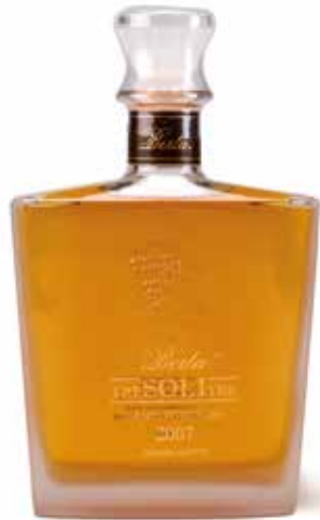
Grappa Tre Soli Tre 8 Jahre fassgelagert