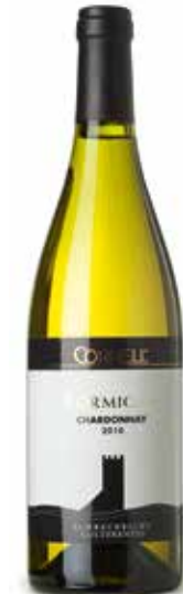
Chardonnay Cornel Formigar DOC