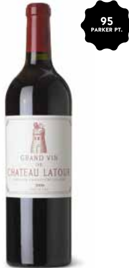
Château Latour 1er Cru Classé