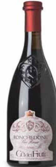
Ronchedone Vino Rosso