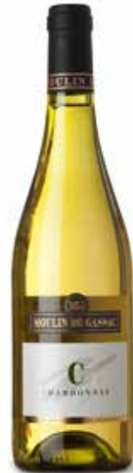
Moulin de Gassac Chardonnay IGP Pays d'Herault

Sein Credo lautet: „Der Winzer ist der Diener der Natur und des Bodens. Er braucht Fingerspitzengefühl, Weisheit und Bescheidenheit im Umgang mit dem Boden, keine Chemie“.