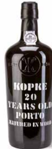
20 Years Old Porto