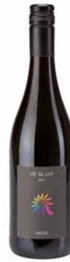
Clé du Ciel Merlot IGP

Brilliante, blassgelbe Farbe mit grünem Widerschein. An der Nase feinfruchtiger Duft nach Blumen, Pfirsich und Birne. Eleganter Gaumen von zarter Cremigkeit und reichhaltigen Fruchtaromen. (100% Chardonnay)