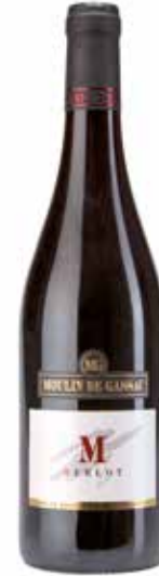
Moulin de Gassac Merlot IGP Pays d'Herault

Ein ausdrucksvoller Wein, Zitrusfrüchte, Birne und weiße Blumennote (Akazie). Frischer Auftakt mit den Aromen von Grapefruit und einer Spur Honig. Gehaltvoll, gut balanciert. Hervorragend zu Fischgerichten, Geflügel, sowie zu mildem Käse. (100% Chardonnay)