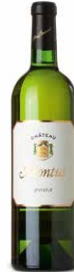
Château Montus Blanc A.O.C. Pacherenc

Erstmals 1985 rüttelte der Wein von Château Montus an der Hierarchie der großen mythischen Rotweine und erregte Aufsehen mit seiner Rebsorte Tannat. Château Montus liegt vollständig auf diesen großen außergewöhnlichen Terroirs und wird in Frankreich auch gern „le Pétrus du Sud-Ouest“ genannt.