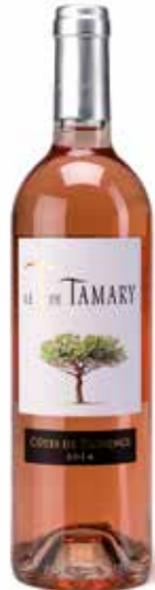
Le T de Tamary Rosé Côtes de Provence AOC