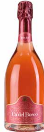
Cuvée Prestige Franciacorta Rosé