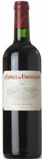
L'Esprit de Chevalier Rouge Grand Vin de Graves