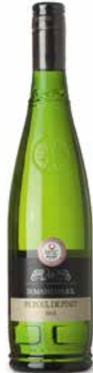
Picpoul de Pinet Domaine Delsol

Typischer Merlot, harmonisch, voll im Geschmack, eleganter, runder Wein. (100% Merlot)