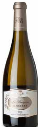
Sancerre La Bourgeoise Blanc A.O.C.