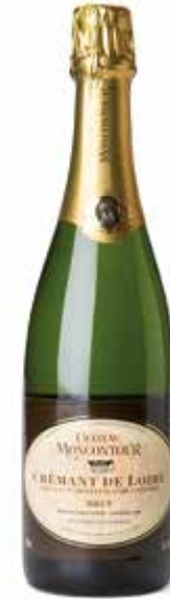
Crémant de Loire Brut