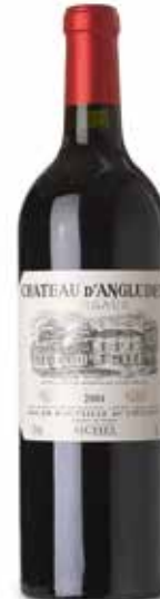
Château Angludet Cru Bourgeois Exceptionnel

(40% Cabernet-Sauvignon, 30% Merlot, 20% Cabernet-Franc, 10% Petit Verdot)