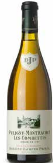
Puligny Montrachet „Les Combettes“ 1er Cru