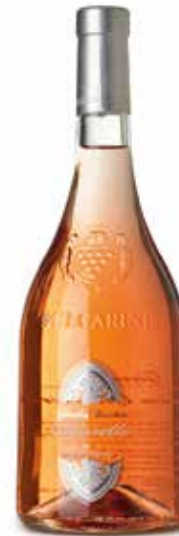
Chiantetto Garda Classico DOC