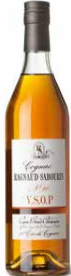
V.S.O.P. Alliance No. 10 1er Cru de Cognac

Vier Jahre alter Branntwein von strohgelber Farbe. Der Holzton neuer Fässer und das Bukett des jungen Cognacs verschmelzen und ergeben blumige Töne.