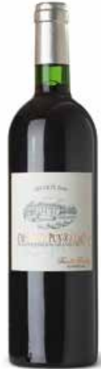
Château Puy Razac St. Emilion Grand Cru