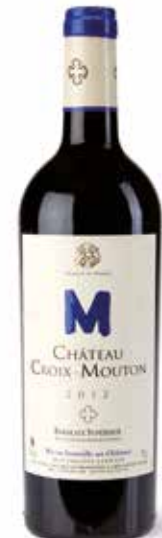
Château Croix-Mouton Bordeaux Supérieur

Kräftig, süffig und entgegenkommend. (Cabernet Franc, Cabernet Sauvignon, Merlot, Petit Verdot, Malbec)