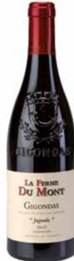
Jugunda Gigondas AOP