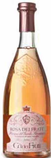
Rosa Dei Frati DOC