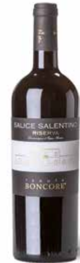
Salice Salentino Riserva DOP