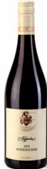
Spätburgunder Hofgarten trocken