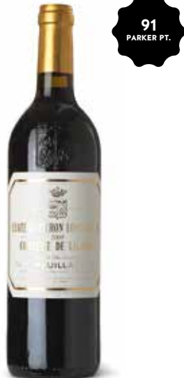
Château Pichon Longueville Comtesse de Lalande 2ème Cru Classé