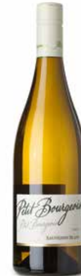
Petit Bourgeois Sauvignon Blanc

Die Betriebsphilosophie der Familie kommt in dem selbst gewählten Motto „Un Art, une Passion, une Tradition“ (eine Kunst, eine Leidenschaft, eine Tradition) bestens zum Ausdruck und wird in allen Bereichen umgesetzt.