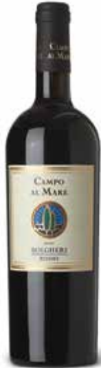
Bolgheri Rosso DOC