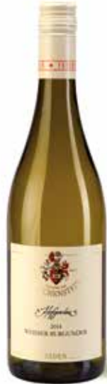
Weisser Burgunder Hofgarten Kabinett trocken