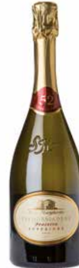
Prosecco 52 Valdobbiadene DOC