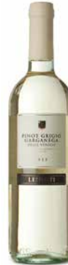
Pinot Grigio Garganega IGT