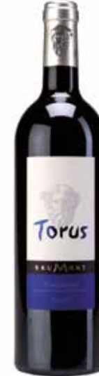
Torus Rouge A.O.C. Madiran

Die seltene fruchtige Rebsorte Gros Manseng wird sehr spät gelesen. Die von leichter Bothrytis befallenen Trauben werden über ein Jahr in Stahlfässern ausgebaut, danach auf Flaschen gezogen. Der Wein ist leicht und jugendlich und hat eine gut ausgeprägte Restsüße mit feiner Säure. (100% Gros Manseng)