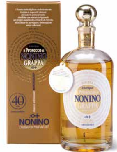
Grappa il Prosecco Riserva in Barriques