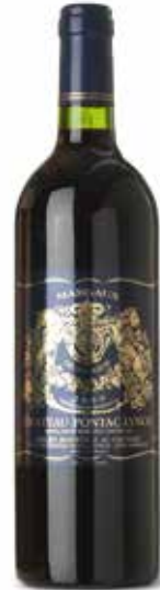
Château Pontac Lynch Cru Bourgeois

Château Pontac-Lynch ist umgeben von den bedeutendsten Weingütern von Margaux. Es grenzt unmittelbar an das berühmte Château Margaux, im Norden und Westen grenzen die Weinfelder an Château Palmer und Château Rauzan-Segla und im Süden an Château d'Issan.