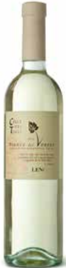
Colle dei Tigli Bianco Veneto IGT