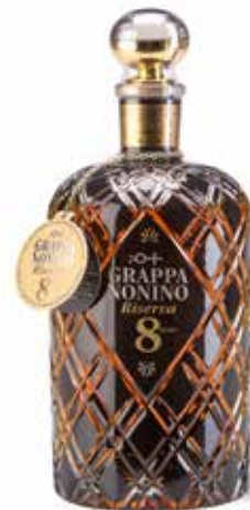
Grappa Riserva 8 Years

Typisch, würzig mit dem Duft von Gebäck und leichtem Geschmack nach grüner Paprikaschote