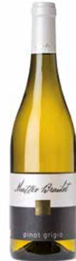
Pinot Grigio IGT