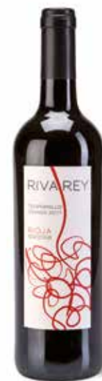
Tempranillo Rivarey Crianza