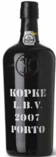
L.B.V. 2007 Porto