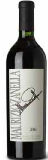
Maurizio Zanella Rosso del Sebino IGT