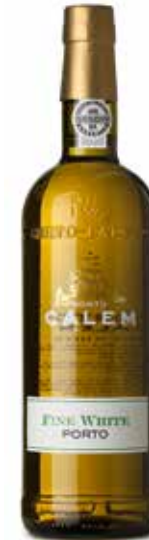
Fine White Porto

(Tinta Roriz, Tinta Cao, Tinta Barroca, Touriga Nacional, Touriga, Francesca)