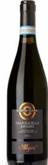
Ripasso Valpolicella Classico DOC