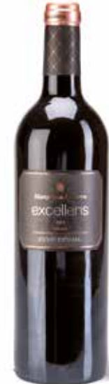
Excellens Cuvée Especial Crianza DOCa Rioja