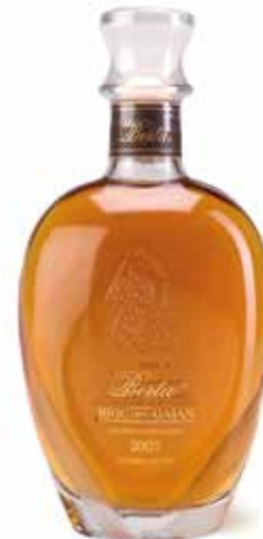
Grappa Bric del Gaian 8 Jahre fassgelagert