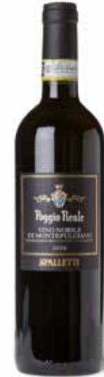
Poggio Reale Vino Nobile di Montepulciano DOCG