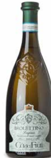
Lugana Brolettino DOC

(Groppello, Marzemino, Sangiovese, Barbera)