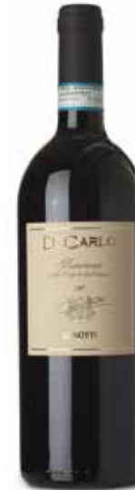
Di Carlo Amarone della Valpolicella Classic DOC

Die besondere Bodenbeschaffenheit und das milde Klima dieser Zone verschaffen den Reben vorteilhafte Wachstumsbedingungen. Besonderer Wert wird auf die Selektion der Trauben gelegt, die in den jeweiligen klassischen Zonen gelesen werden.