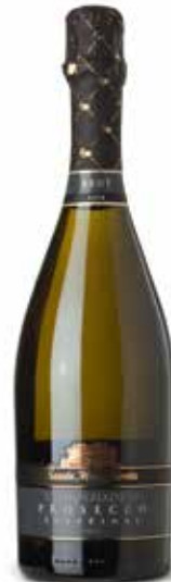
Prosecco Spumante DOCG Valdobbiadene