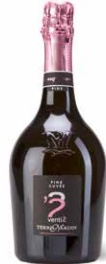
Pink Cuvée Venti 2 Rosé Vino Spumante Extra Dry