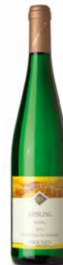
Lieserer Schloßberg Riesling