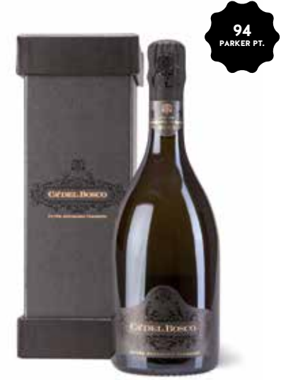
Cuvée Annamaria Clementi Franciacorta Riserva Brut