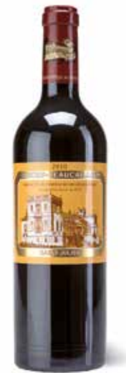
Château Ducru-Beaucaillou 2ème Cru Classé

(86% Cabernet-Sauvignon, 10% Merlot, 4% Cabernet Franc)