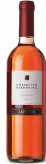
Chiaretto Bardolino Classico DOC