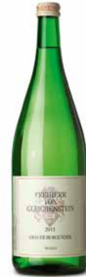
Grauer Burgunder Qualitätswein trocken

Fruchtige Aromen nach reifen Zuckermelonen, süßen Birnen und Aprikosen. Geschmeidig-rundes Mundgefühl und eine prägende Mineralität. Im Abgang bleibt eine angenehm anregende bittere Note. (100% Grauburgunder)