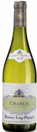
Domaine Long-Depaquit, Chablis Villages