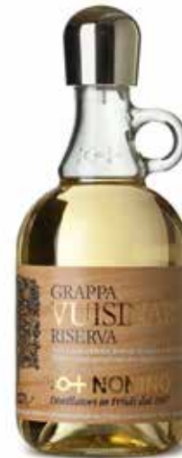
Grappa Vuisinar Riserva Grappa della Tradizione