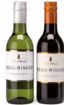
Beau Rivage Blanc Beau Rivage Rouge

(55% Merlot, 25% Cabernet-Sauvignon, 20% Cabernet-Franc)