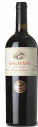
Gaudium Gran Vino

(85% Tempranillo, 7,5% Garnacha Tinto und 7,5% Graciano)