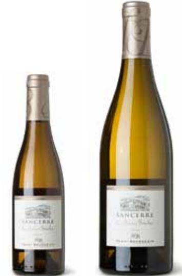
Sancerre Les Bonnes Bouches Blanc