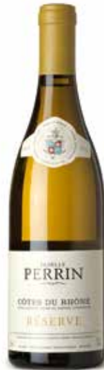
Perrin Réserve Blanc Côtes du Rhône A.C.

(Die 13 Rebsorten der Appellation Châteauneuf-du-Pape: Mourvèdre 30%, Grenache 30%, Syrah 10%, Counoise 10%, Cinsault 5% und verschiedene 15% : Vaccarèse, Terret noir, Muscardin, Clairette, Picpoul, Picardan, Bourboulenc, Roussanne)