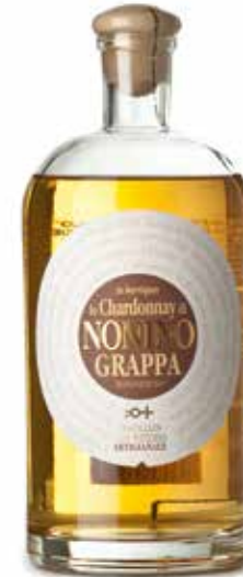
Grappa lo Chardonnay Grappa il Merlot Grappa il Moscato

Diese Brände werden in die typischen Apothekerflaschen abgefüllt und einzeln in Geschenkverpackung geliefert.