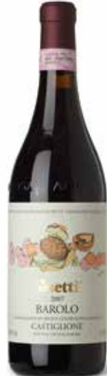
Barolo Castiglione DOCG