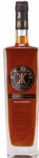
Old Brandy Reserva Aguardente Vinica Velha Reserva