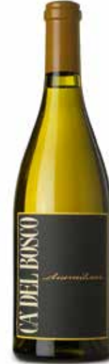
Chardonnay Terre di Franciacorte DOC

(Cabernet Sauvignon, Cabernet Franc, Merlot, Nebbiolo, Barbera)