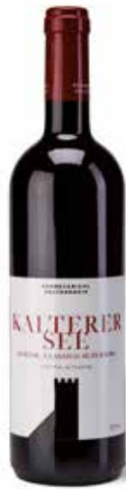
Kalterer See Auslese DOC