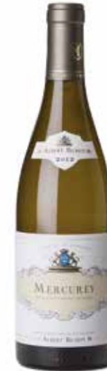
Mercurey Blanc Côte de Chalonnaise