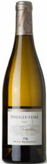
Pouilly Fumé „En Travertin“