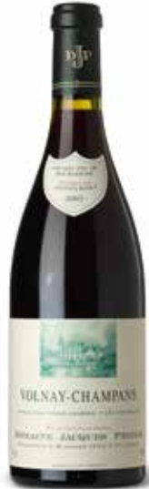
Volnay-Champans 1er Cru Champagne