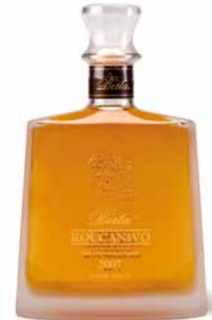
Grappa Roccaniv 8 Jahre fassgelagert