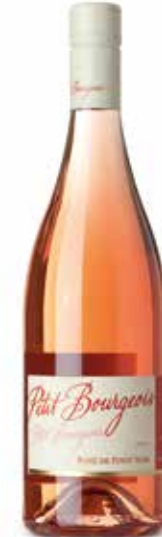
Petit Bourgeois Rosé de Pinot Noir