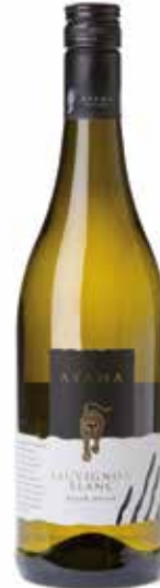
Sauvignon Blanc Western Cape