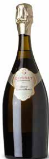
Grand Blanc de Blancs