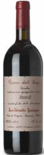
Rosso del Bepi IGT