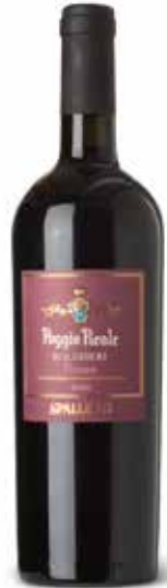
Poggio Reale Bolgheri Rosso DOC