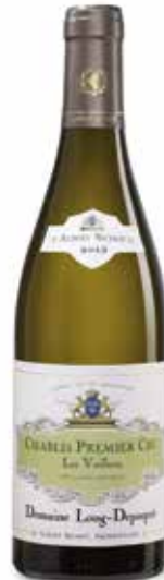
Domaine Long-Depaquit Chablis 1er Cru „Les Vaillons“