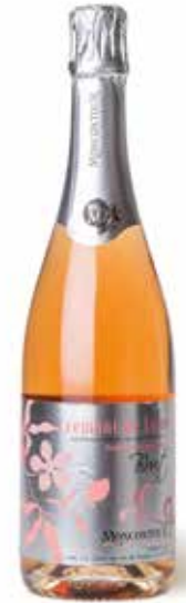
Crémant de Loire Rosé Brut