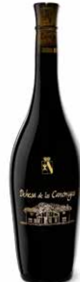
Gran Reserva in Amphorenflasche

(85% Tempranillo, 12% Cabernet-Sauvignon, 3% Albillo)