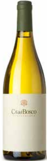
Curtefranca Bianco DOC