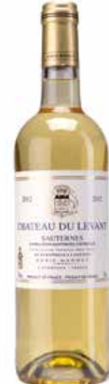
Château du Levant Sauternes et Barsac AOC