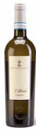
Lugana Il Rivale DOC