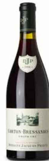
Corton Bressandes Grand Cru