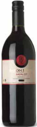
Baron Louis Merlot Ausschankwein