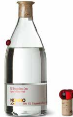
ÚE di Fragolino „Monovitigno“ Cru Vigna Nonino in Friuli ÚE Cru Monovitigno

Bernsteinfarben und verlockend ist Prunella Mandorlata ein leichter und feiner Likör. Der ungewöhnliche Eindruck von bitteren Mandeln ist durch die Grundlage von Pflaumenbrandwein veredelt.