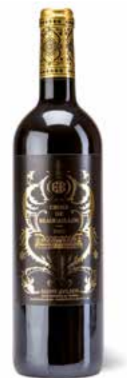
Croix de Beaucaillou Zweitwein Ch. Ducru-Beaucaillou