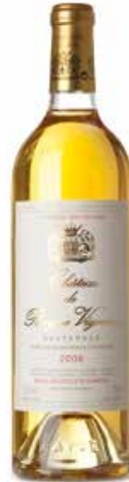
Château Rayne Vigneau 1er Cru Classé