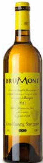
Gros Manseng Sauvignon IGP Côtes de Gascogne