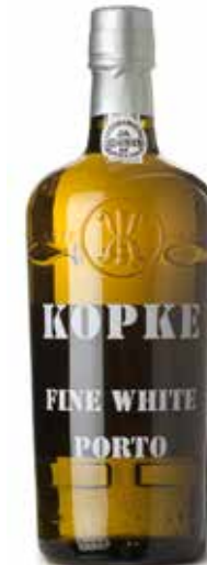
Fine White Porto