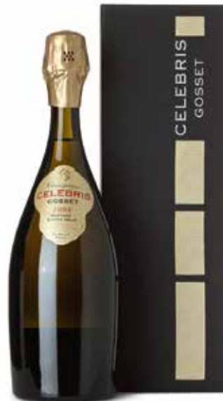
Celebris Vintage Extra Brut