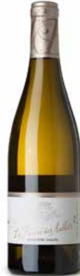
Menetou Salon A.O.C.