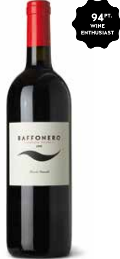
Baffonero Maremma IGT